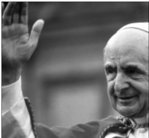
PAOLO VI È BEATO