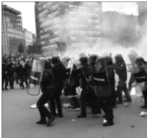
MANCA IL LAVORO, IL DISAGIO VA IN PIAZZA