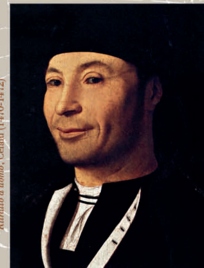
Ritratto d'uomo, Cefalù (1470-1472)

Prospettive filosofiche a confronto per un umanesimo decentrato