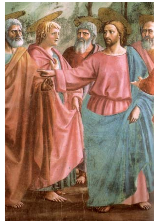
Masaccio - Il pagamento del tributo Cappella Brancacci, S.Maria del Carmine - Firenze

L'umanità del prete, testimone della nuova umanità in Cristo, per un nuovo umanesimo