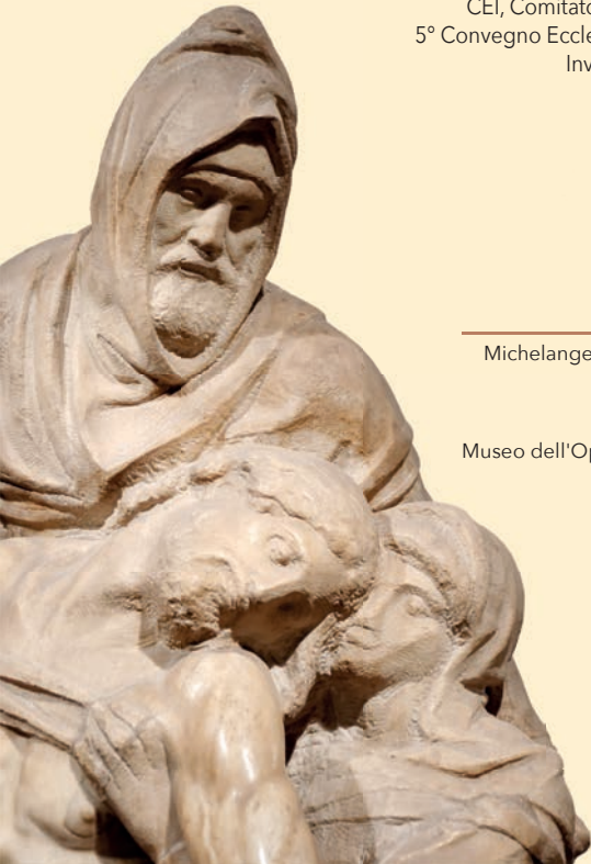
Michelangelo, Pietà Bandini , 1547-1555 circa, statua in marmo, altezza 226 cm. Museo dell'Opera del Duomo, Firenze.

CEI, Comitato preparatorio al 5° Convegno Ecclesiale Nazionale, Invito al Convegno